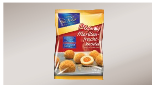
Art.-Nr. 002224 TK Marillenfruchtknödel ca. 65 g, vorgekocht & gebrösel, 4 x 1,625 kg/Karton