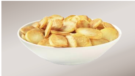
Art.-Nr. 008613 Kartoffelscheiben in Öl 10 mm, 2 kg Beutel