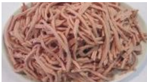
Art.-Nr. 000971 Wurstsalat Streifen 1 kg Atmospack

REGIONAL UND SCHNELL. VIELSEITIG UND FRISCH.