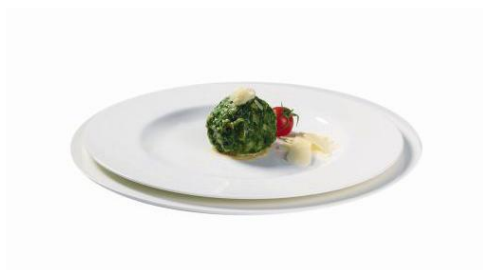
Art.-Nr. 002209 TK Spinatknödel 3 x 20 x ca. 100 g (Semmelteig) roh, 3 x 2 kg Karton