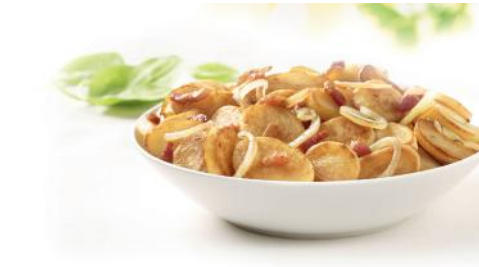
Art.-Nr. 008606 Bratkartoffeln mit Speck & Zwiebeln 2 kg Beutel