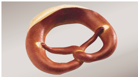
Art.-Nr. 008903 TK Laugenbrezel mit Schnitt gebacken, ca. 83 g, 4 x 10 Stück/Karton