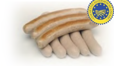
Art.-Nr. 035032 Original Thüringer Rostbratwurst gebrüht, vakuumverpackt, Kal. 32/34, 12 x 120 g/Packung