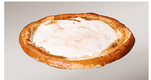
Art.-Nr. 007500 TK Brezelpizza Rohling mit Salzbeilage, Ø 26 – 28 cm, 40 x ca. 210 g im Karton