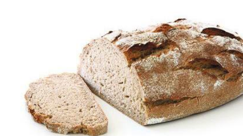
Art.-Nr. 002445 TK Krustenbrot oval vorgebacken, 32 % Roggenanteil, 10 x 1.060 g