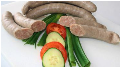
Art.-Nr. 022574 Odenwälder Bratwurst grob vakuumverpackt, gebrüht, ca. 10 x 120 g