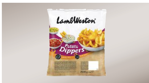
Art.-Nr. 006292 TK Potato Dippers 4 x 2,5 kg/Karton