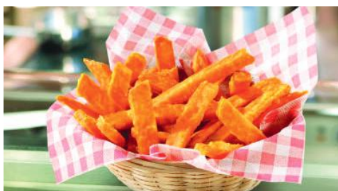
Art.-Nr. 006295 TK Sweet Potato Fries Süßkartoffelpommes, 4 x 2,5 kg