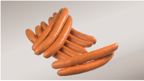
Art.-Nr. 035024 Bockwurst Atmospack, Kal. 32/34, 12 x 120 g/Packung