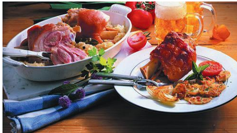
Art.-Nr. 006035 TK Bayerische Grillhax'n gepökelt, geräuchert & gegart, 12 x ca. 575 g