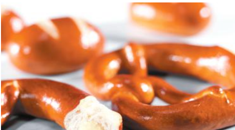
Art.-Nr. 008901 TK Laugenbrezel „schwäbische Art“ mit Butter, fertig gebacken, 4 x 12 Stück im Karton, ca. 79 g