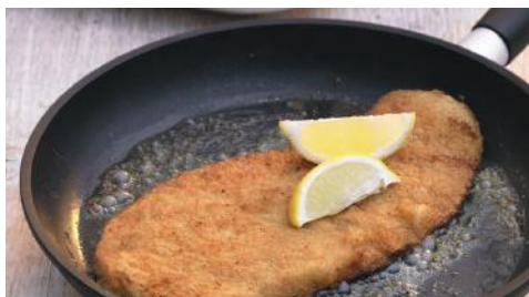
Art.-Nr. 008042 TK Schweinelachs-Schnitzel roh, paniert, 40 x 180 g/Karton