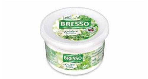
Art.-Nr. 001723 Bresso Frischkäse-Topf mit Kräutern der Provence 60 % F. i. Tr., 1,5 kg