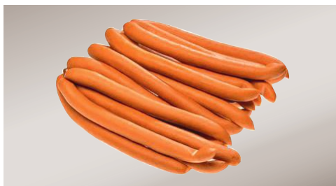
Art.-Nr. 035011 Wiener Würstchen Kal. 20/22, Atmospack, 20 x 50 g/Packung