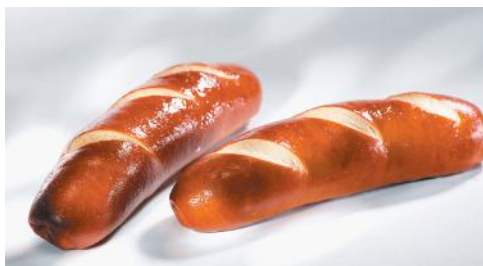
Art.-Nr. 008917 TK Laugensandwich fertig gebacken, 48 x 100 g im Karton