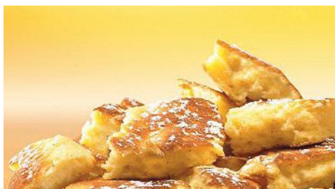
Art.-Nr. 002240 TK Kaiserschmarrn ohne Rosinen 5 x 1 kg im Karton