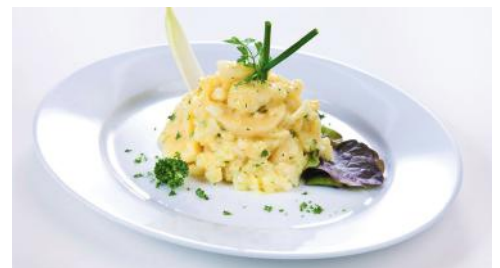
Art.-Nr. 414050 Frischer Kartoffelsalat natur ohne Speck, o.d.Z., 5 kg Eimer