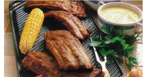
Art.-Nr. 006043 TK Spareribs gebraten, o.d.Z., einzeln entnehmbar, ca. 5 kg