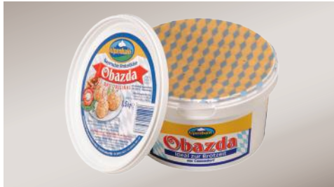
Art.-Nr. 010856 Obazda pikant gewürzte Käsezubereitung, 60 % F. i. Tr., 1,5 kg