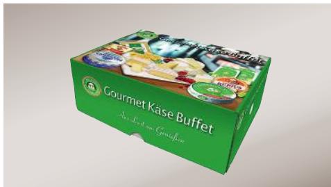
Art.-Nr. 001721 Gourmet Käsebuffet 6-fach, 1,91 kg Karton