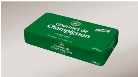
Art.-Nr. 001726 Gourmet de Champignon 60 % F. i. Tr., 1 kg Stück