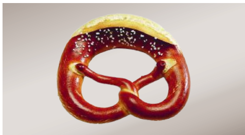
Art.-Nr. 008938 TK Laugenbrezel mit Schnitt ca. 100 g, Teigling, 4 x 20 Stück im Karton