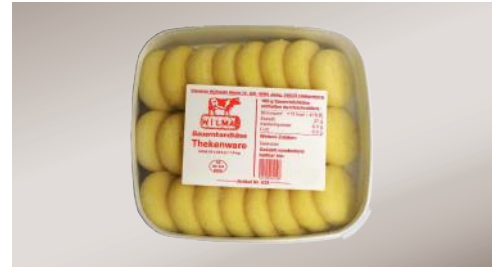
Art.-Nr. 010201 Bauernhandkäse ohne Kümmel lose, 24 x ca. 62,5 g, 1,5 kg Schale