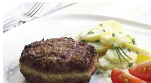
Art.-Nr. 008072 TK Frikadelle aus magerem Schweinefleisch gebraten, 30 Stück à 120 g/Karton