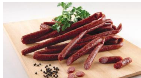
Art.-Nr. 000486 T. Schwarzwälder Kaminruten ca. 2,2 kg Beutel