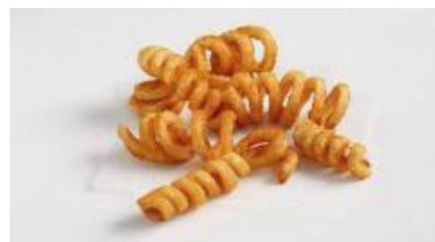
Art.-Nr. 006290 TK Seasoned Twisters gewürzte Kringelpommes, 4 x 2,5 kg/Karton