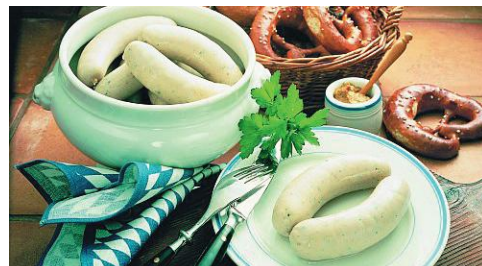
Art.-Nr. 006066 TK Münchner Weißwurst paarweise entnehmbar, 120 g/Paar, 33 Paar 3,96 kg