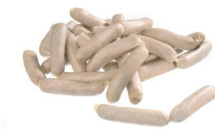
Art.-Nr. 035038 Mini-Rostbratwürstchen vakuumverpackt, Kal. 24, 60 x 25 g