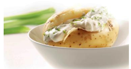
Art.-Nr. 008616 Folienkartoffel vakuumverpackt, 200 – 275 g/Stück, 8 x 4 Stück/Beutel