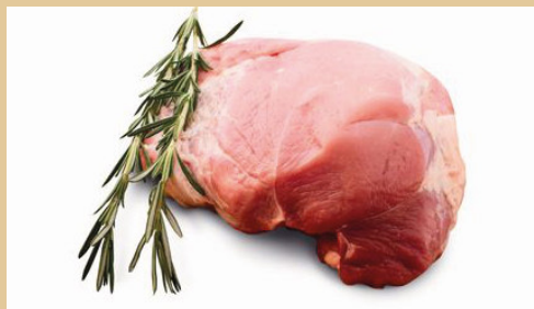
Artikelnr.: 1430 Kalbsoberschale "Rose" mit Deckel, vac. verpackt ca. 5,0 kg