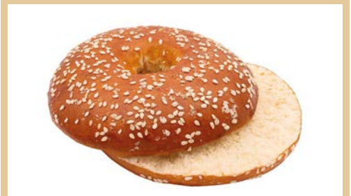
Artikelnr.: 7690 TK FF-Laugenbagel mit Sesam geschnitten, fertig gebacken 60 x 80 g/KT