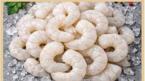
Artikelnr.: 6326 TK Riesengarnelen 26/30 geschält 20% 1,0 kg