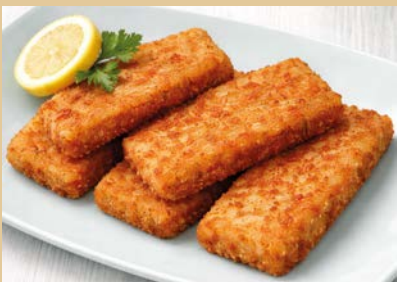
Artikelnr.: 6297 TK MSC Knusperfisch Alaska Seelachs paniert, vorgebacken ca. 100 St. á 50 g, 5 kg/Kt

kostenlose Lieferung ab 350,-€ Warenwert