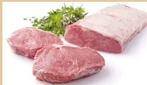
Artikelnr.: 1432 Kalbs-Rücken "Rose" mit Deckel, vac. verpackt ca. 5,0 kg